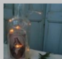
dans mes mains