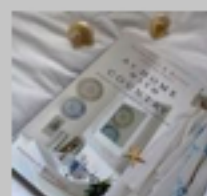
au fil des pages